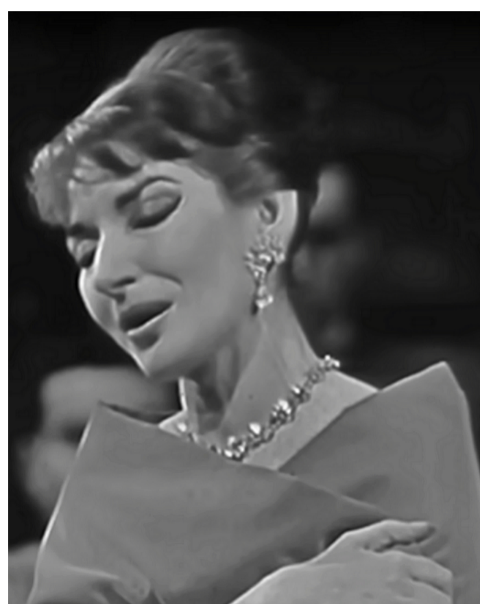
Legendäre Opern-Diva: Maria Callas (1923-1977)